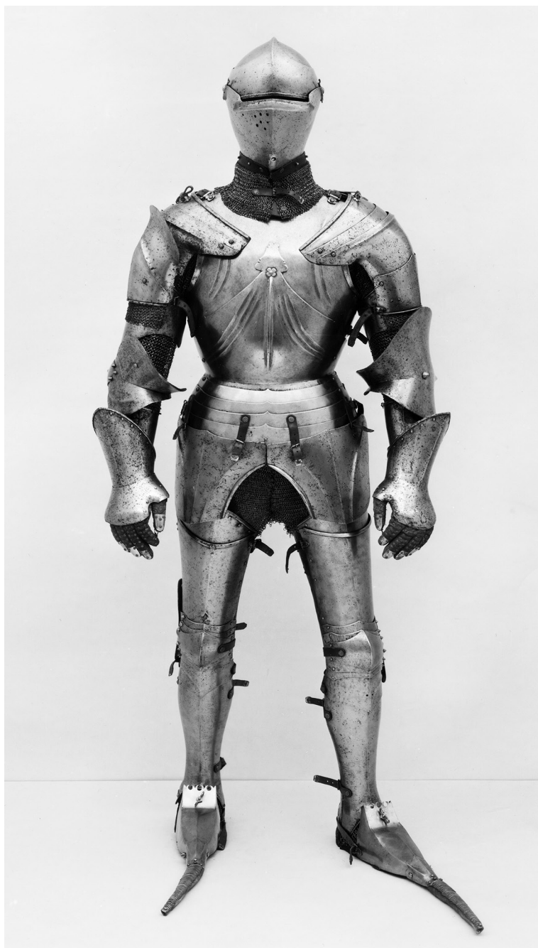
Arnés blanco italiano (c. 1450-1460). Museo Metropolitano de Arte, Nueva York.