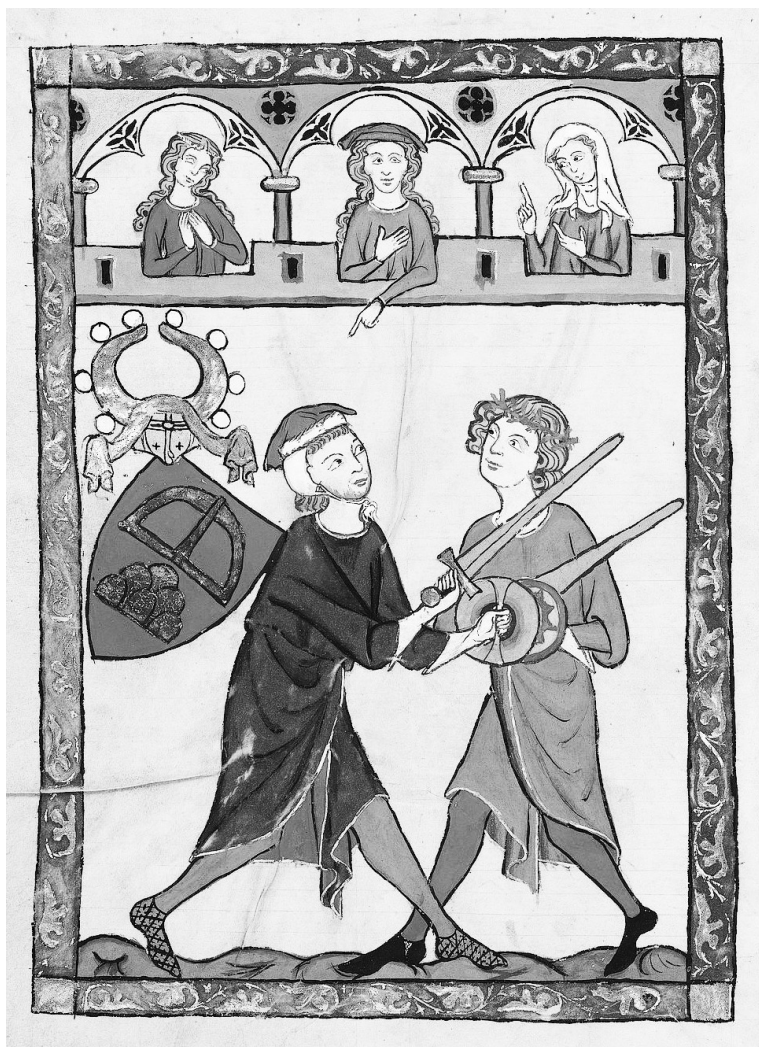
Arriba, miniatura del manuscrito medieval Codex Manesse, de Johann von Ringgenberg (c. 1340). Los contrincantes luchan con espadas de armar y broqueles. Abajo, kaskara sudanesa, s. XIX. Royal Armouries.